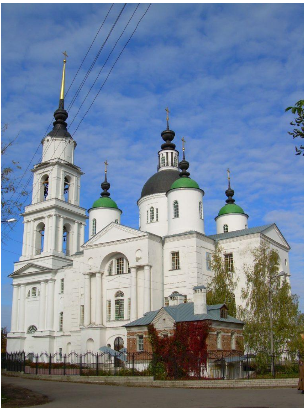
Троицкий собор, 1806-1818 гг. Липецкая область, Чаплыгинский район, г. Чаплыгин